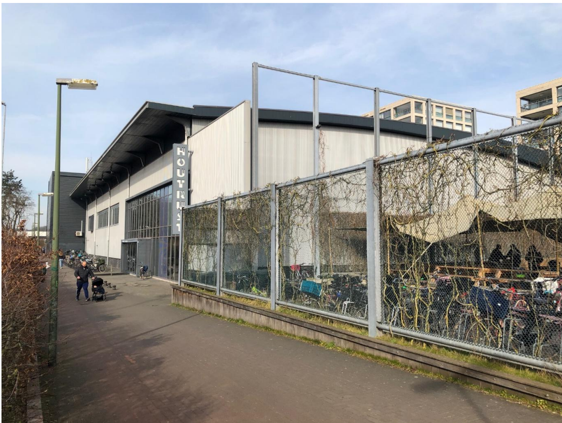
Foto: Voorkant sporthal Houtrust